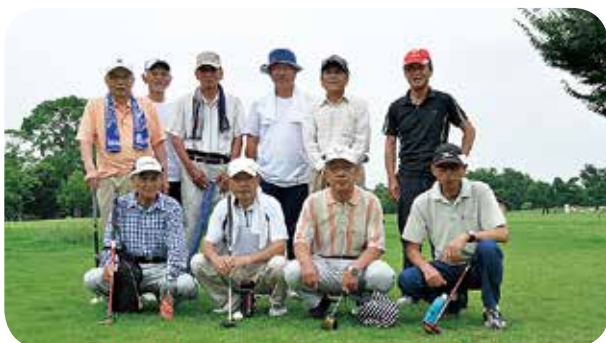
パークゴルフクラブ