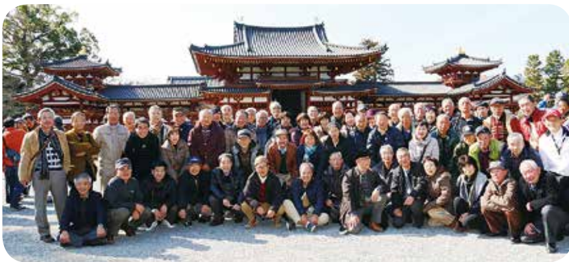
会員親睦会(日帰り旅行)

会員互助会は、会員間の交流・親睦等をスタンスとして諸活動を実施。会員が一堂に会する親睦会(旅行等)や会員個々の趣味嗜好・娯楽・教養等を共有する同好会(各クラブ)の活動を展開しています。