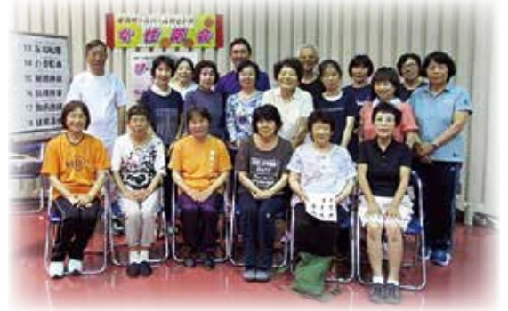
健康体操参加の皆さん