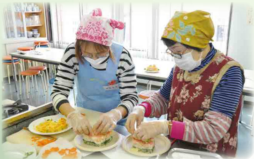
ちらし寿司ケーキづくり