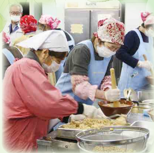
味噌づくり講習会