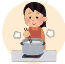
調理・配膳・片付け