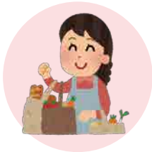
日用品のお買い物